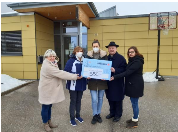
Spendenübergabe an die Tageswerkstätte