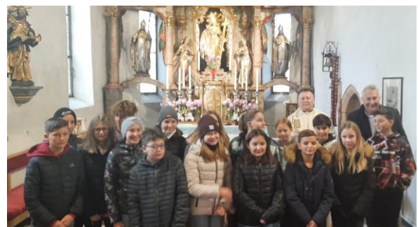
Unsere Firmlinge/birmanke in birmanci

Župljani smo bili presenečeni, kako dobre odgovore so dajali starši, botri in drugi povprašani ljudje. Mnogi so pozneje pri kavi bili mnenja, da bi se takšno bogoslužje moralo večkrat pripraviti. Hvala birmancem za povpraševanje, ostalim pa za lepa mnenja o tem, kje živi Bog v Žitari vasi.